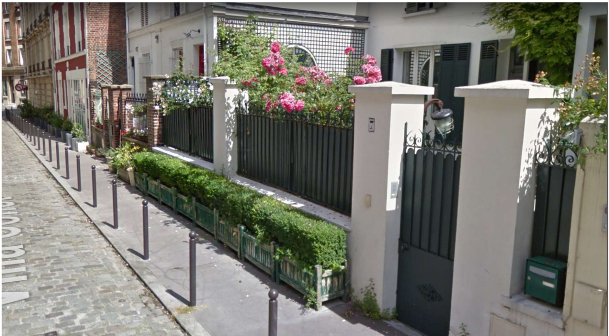
Villa Collet, Paris