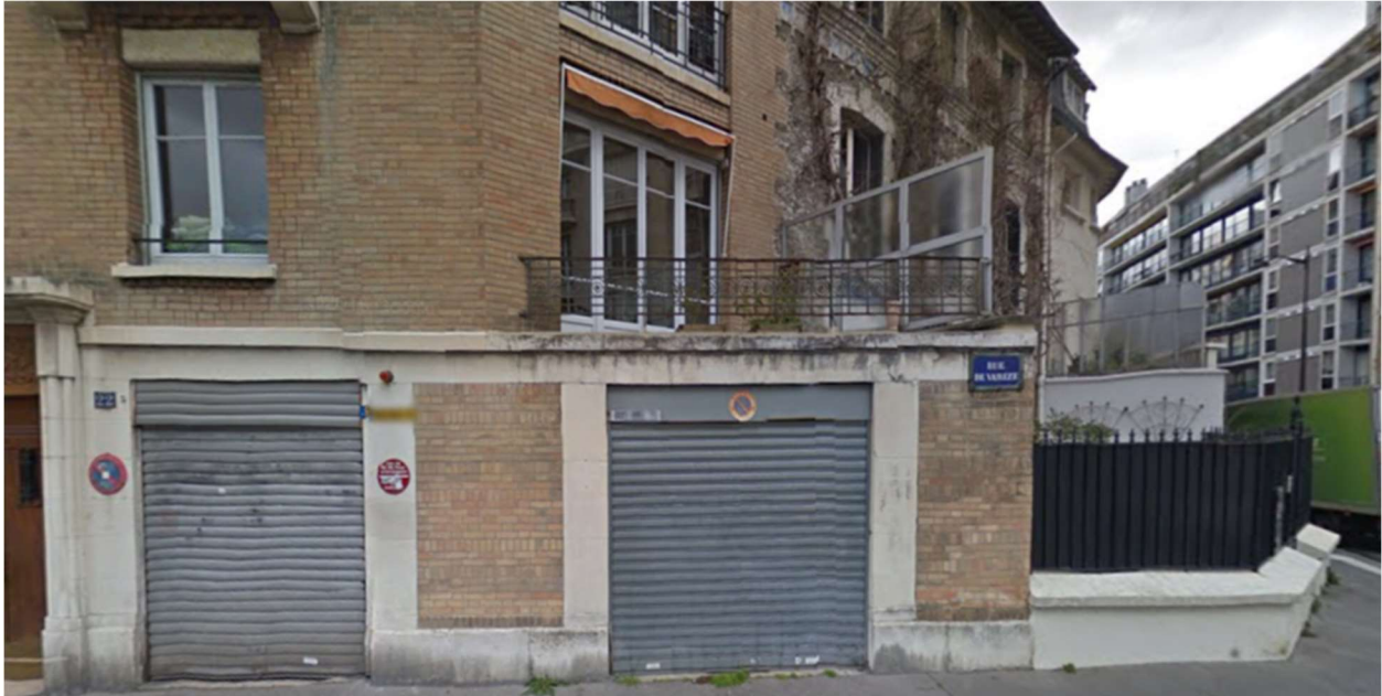
Rue de Varize, Paris