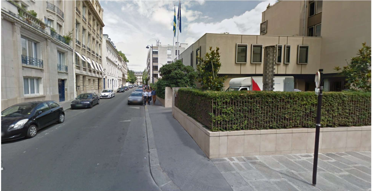
Rue de Chanaleilles, Paris